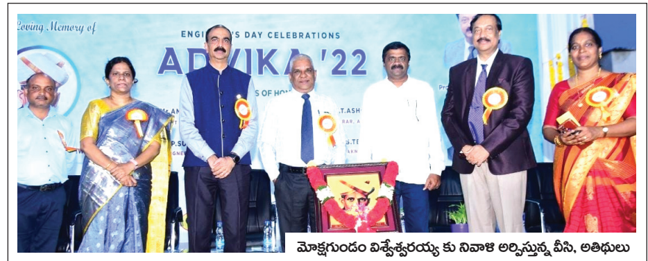
మోక్షగుండం విశ్వేశ్వరయ్య కు నివాళి అర్పిస్తున్న వీసీ, అతిథులు