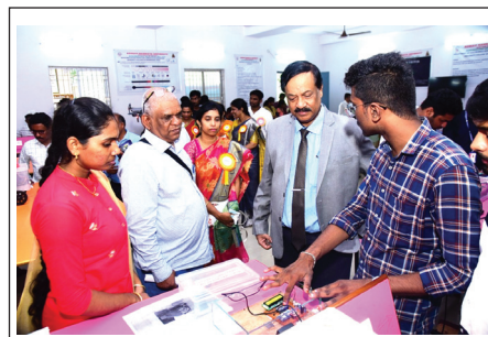
ఇంజనీరింగ్ ప్రాజెక్టులను పరిశీలిస్తున్న వీసీ