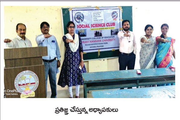
ప్రతిజ్ఞ చేస్తున్న అధ్యాపకులు